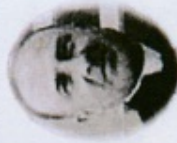
Père Georges Finet

Les Foyers de Charité, nés en 1936, sous l'impulsion de Marthe Robin et du Père Finet, sont une Œuvre catholique internationale. Ils ont pour mission essentielle de proposer des retraites spirituelles ouvertes à tous, croyants ou non. Ils sont aujourd'hui présents dans quarante pays.